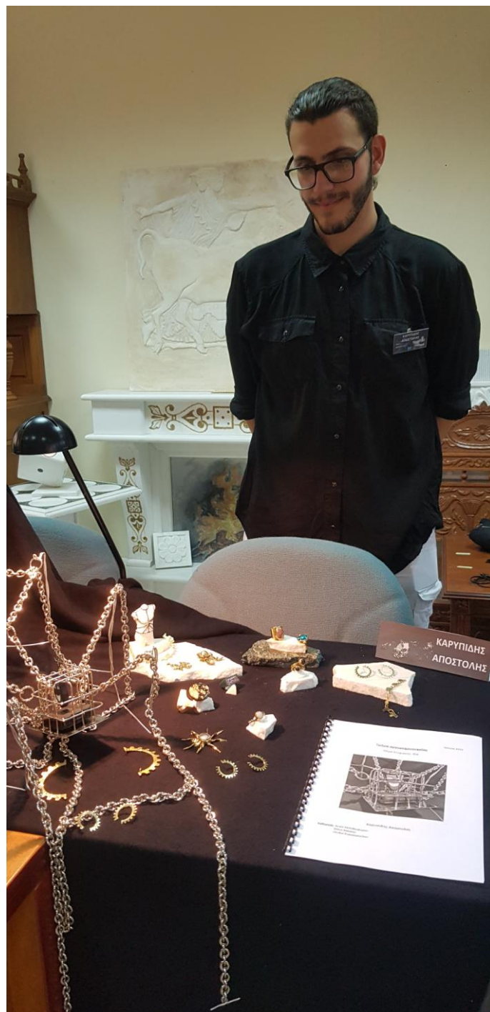
Θέμα πτυχιακής εργασίας «Λεκτική Βία»