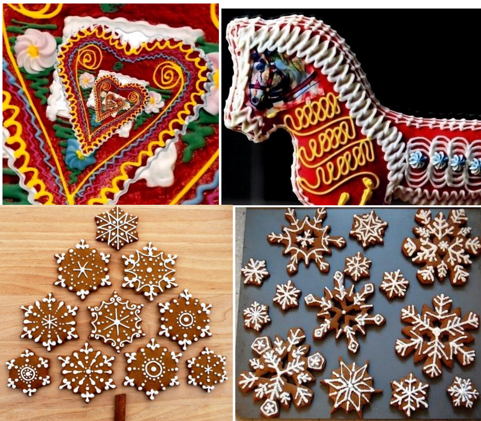
Τζίντζερμπρεντ σε διάφορα σχέδια από την Κροατία, την Πολωνία και την Γαλλία