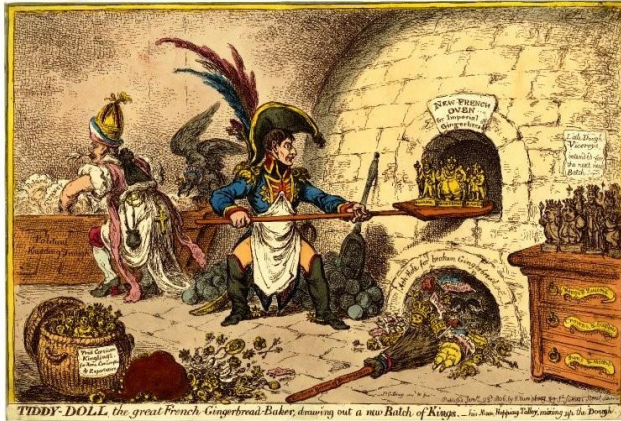
Έγχρωμη γκραβούρα, Βρετανικό Μουσείο, 1806

Η δεύτερη μεγάλη διαφοροποίηση από τα κλασσικά ψωμάκια-κουλουράκια ήταν το σπίτι- τζίντζερμπρεντ, το οποίο κατασκευάστηκε το 1800 στη Νυρεμβέργη της Γερμανίας και αποτέλεσε έμπνευση των αδελφών Γκρίμ, όταν έγραψαν το 1812 το παραμύθι «Χάνσελ και Γκρέτελ».