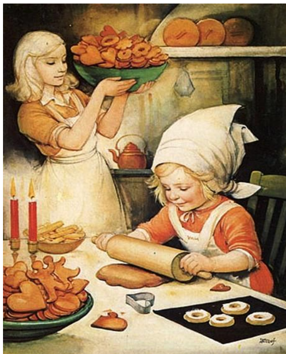
Φτιάχνοντας τζίντζερμπρεντ στο σπίτι, Helge-Artelius, 19 ος -20 ος αι.

Run, run, fast as you can, You can't catch me, I'm the gingerbread man!