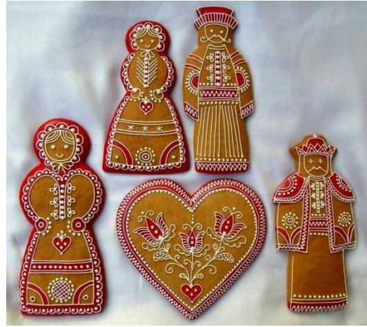
Τζίντζερμπρεντ – ανθρωπάκια από την Αγγλία