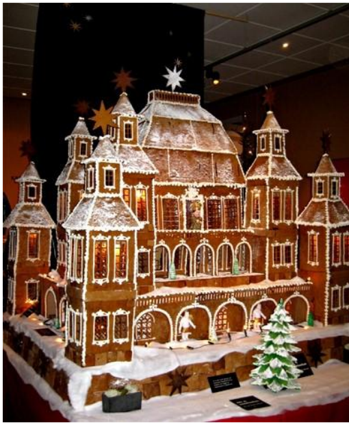
Ανάκτορο κατασκευασμένο από πλάκες τζίντζερμπρεντ, στολισμένο με ζαχαρόπαστα

Η δεύτερη μεγάλη διαφοροποίηση από τα κλασσικά ψωμάκια-κουλουράκια ήταν το σπίτι- τζίντζερμπρεντ, το οποίο κατασκευάστηκε το 1800 στη Νυρεμβέργη της Γερμανίας και αποτέλεσε έμπνευση των αδελφών Γκρίμ, όταν έγραψαν το 1812 το παραμύθι «Χάνσελ και Γκρέτελ».