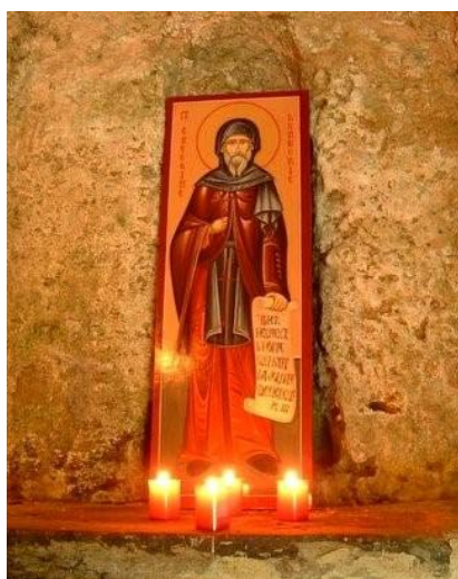
Ο άγιος Γρηγόριος ο Αρμένιος

Σύμφωνα με τις έως σήμερα πληροφορίες που διαθέτουμε, όλα ξεκίνησαν το 992 μ.Χ., όταν ο καλόγερος Γρηγόριος από την Νικόπολη της Αρμενίας και μετέπειτα άγιος της καθολικής εκκλησίας, εγκαταστάθηκε στην πόλη Bondaroy της Γαλλίας όπου και έζησε μέχρι το τέλος της ζωή του, το 999. Γνωρίζουμε ελάχιστα πράγματα για τη ζωή, το έργο και τη διδασκαλία του και το πώς αυτή επηρέασε την εκεί κοινωνία. Εκείνο όμως που γνωρίζουμε είναι ότι θεωρείται ο «πατέρας» των χριστουγεννιάτικων εδεσμάτων με την ονομασία τζίντζερμπρεντ, δηλαδή γλυκό ψωμί αρωματισμένο με τζίντζερ.